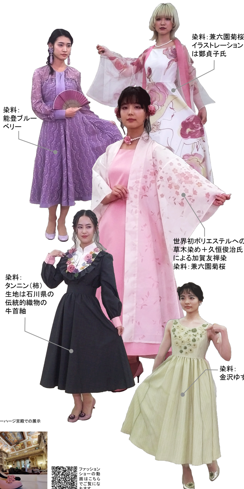
染料: 兼六園菊桜 イラストレーションは鄭貞子氏