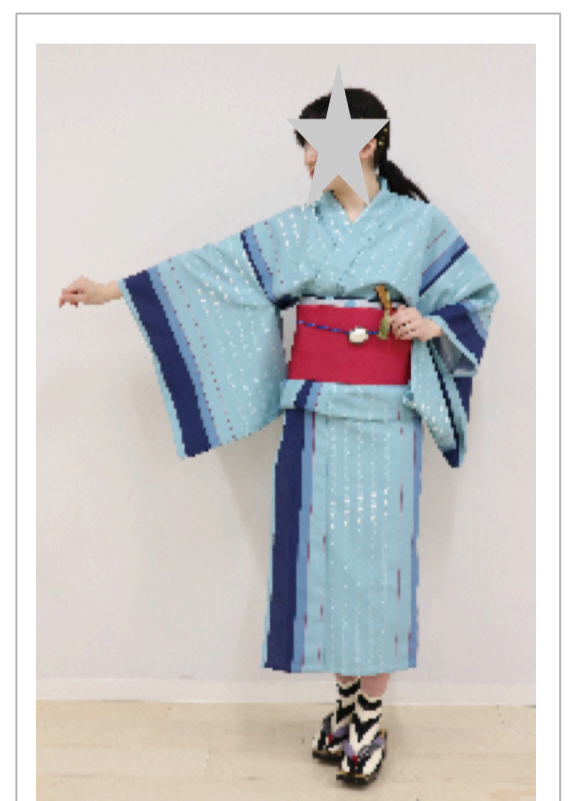
スタイリングの事例